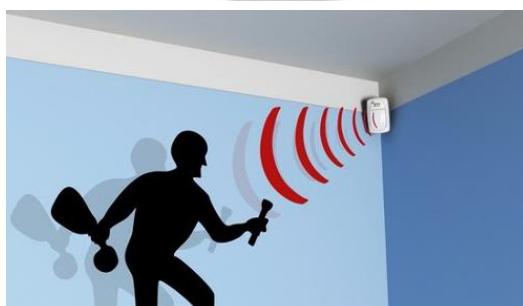
Sistema de Alarma Contra Robos